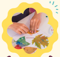
ARTE Y PINTURA